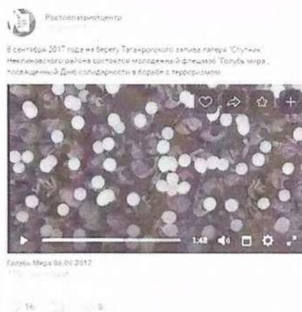
Рисунок 8 – Информация о прошедшем мероприятии в социальной сети «ВКонтакте»

Видеоматериал как один из результатов состоявшейся акции был распространен через отдельную публикацию (см. рисунок 8).