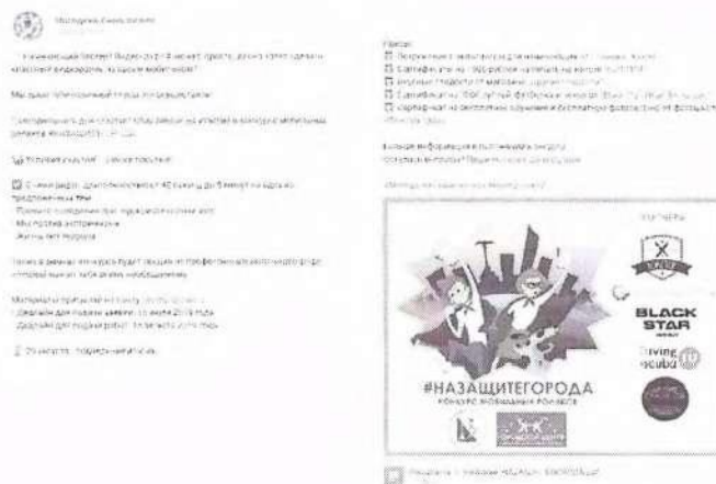
Рисунок 1 – Анонс мероприятия в социальной сети

В анонсе должна содержаться информация, разъясняющая что, где, когда и кем проводится. Данные могут предоставляться дозированно, обязательный элемент – наличие прямых контактов организаторов (см. рисунок 1).