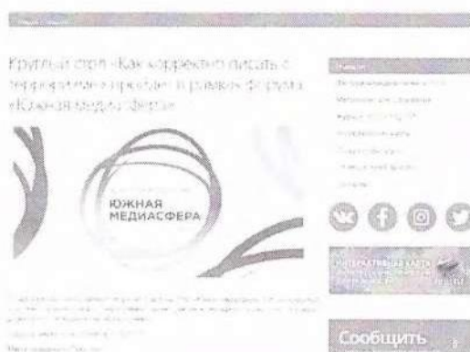
Рисунок 9 – Информация о предстоящем мероприятии

Данный пункт можно проиллюстрировать мероприятием – Круглый стол «Как корректно писать о терроризме», который прошел в рамках форума «Южная медиасфера» (см рисунок 9).