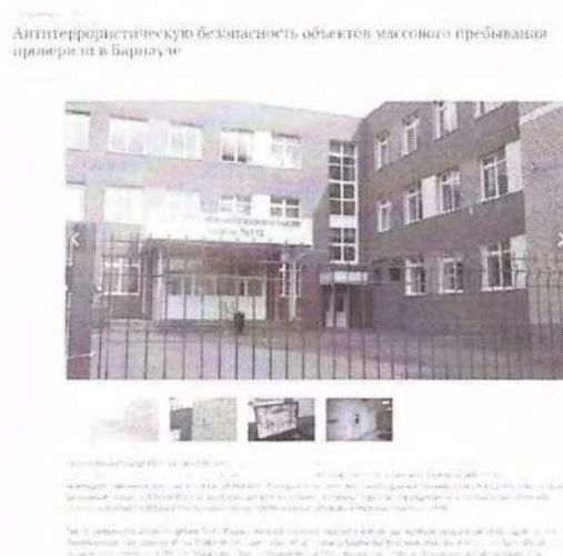
Рисунок 11– Информация о прошедшем мероприятии

Другой пример – мероприятие по мониторингу обеспечения антитеррористической безопасности объектов массового пребывания в г. Барнаул (см. рисунок 11).