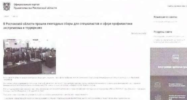
Рисунок 10 – Информация о прошедшем мероприятии

Иллюстрацией информационного освещения мероприятий такого рода является проведение ежегодных сборов для специалистов, организованных Антитеррористической комиссией Ростовской области. В новостной публикации сообщается, что ключевой темой встречи было обсуждение принятого Комплексного плана–2023, также в программу сборов входили лекции представителей силовых ведомств, регионального министерства образования и департамента потребительского рынка (см. рисунок 10).