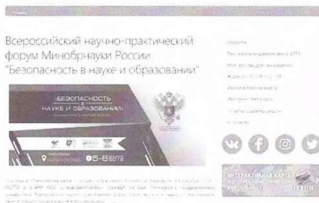
Рисунок 2 – Краткий пресс-релиз

Краткий пресс-релиз обычно содержит информацию с приглашением посетить мероприятие, зарегистрироваться или получить аккредитацию для представителей СМИ. Пример размещенного пресс-релиза продемонстрирован на рисунке 2.