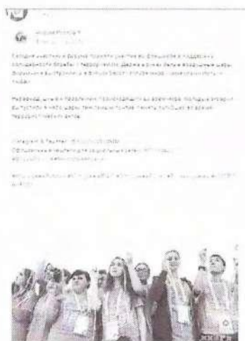
Рисунок 7 – Информация о проходящем мероприятии в социальной сети «ВКонтакте»

Видеоматериал как один из результатов состоявшейся акции был распространен через отдельную публикацию (см. рисунок 8).