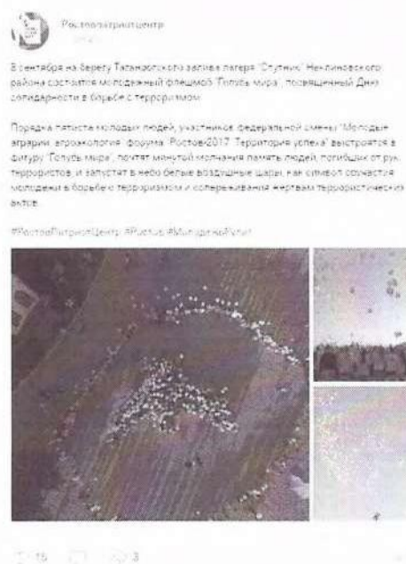
Рисунок 6 – Информация о предстоящем мероприятии в социальной сети «ВКонтакте»

Иллюстративным примером можно привести акцию памяти «Голубь мира», проведенную Ростовпатриотцентром в 2017 году. В сети Интернет была размещена анонсирующая информация (см. рисунок 6).