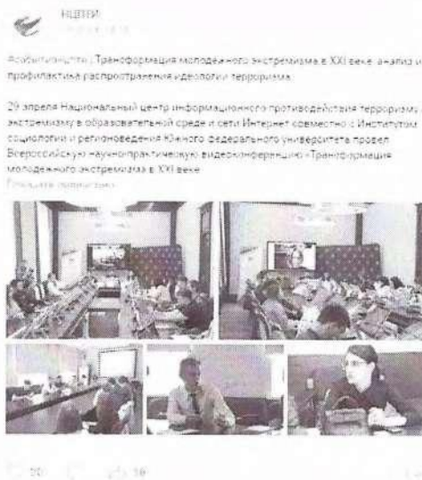
Рисунок 12 – Информация о прошедшем мероприятии